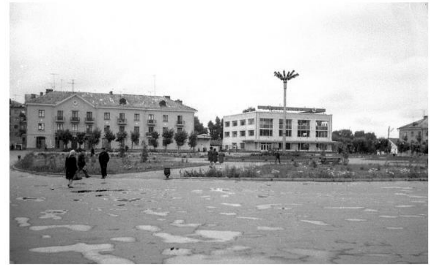
Будівля нового Центрального універсагу, 1969 рік

Нині – це «Площа молоді», яка має вигляд прямокутного відкритого простору, покритого бетонними плитами, обрамлена кущистою рослинністю та заповненою деревами (ялини+клени) по куткам. Розташована за 400 метрів на захід від центральної площі міста та приміщення Коростенської міської ради. По середині площі розміщено стелу та основу від колишнього «пам'ятника комсомольцям», виконану із червоного граніту. Вздовж кущистих насаджень встановлені лави.