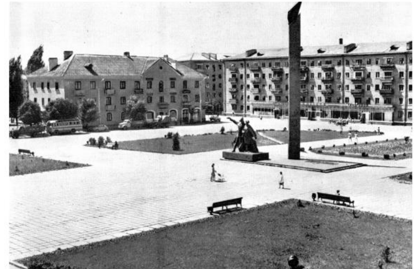
Пам'ятник комсомольцям 20-х років, 1973 рік

Фотоматеріали із книги «ІЛЮСТРОВАНА ІСТОРІЯ ВУЛИЦЬ І РАЙОНІВ МІСТА КОРОСТЕНЬ». Авт: Сергій Гераймович