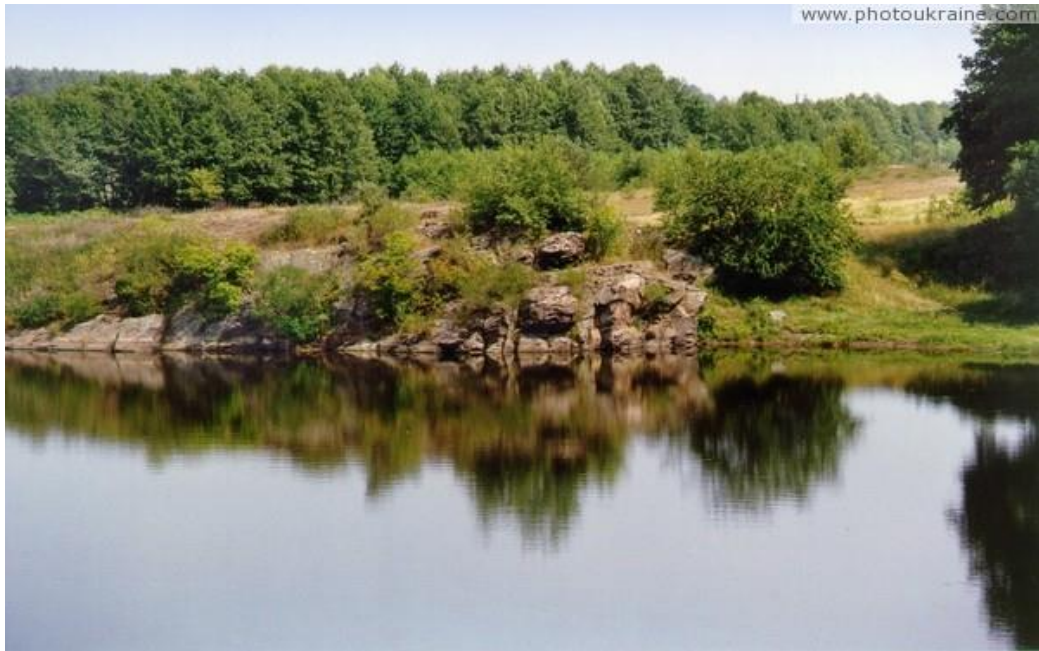
Мал. 1 Річка Уж на околиці міста Коростень.

Територія Коростенської громади розташована у північній частині Житомирської області та межує на півдні та західному півдні – із Ушомирською, на півдні та східному півдні – із Іршанською, на південному сході – із Чоповицькою, на сході – із Малинською, на північному сході та на півночі – із Народицькою, на півночі – з Овруцькою, на заході – із Лугинською територіальними громадами.