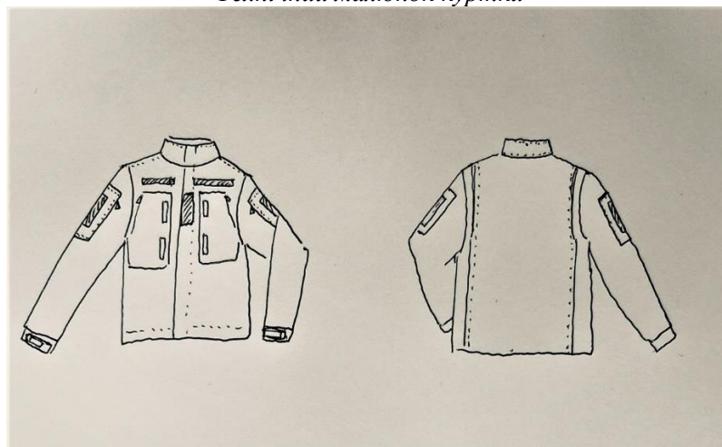
Технічний малюнок куртки

На низу рукавів розміщуються манжети та вшивні пати. Ширина рукавів по низу регулюється застібанням пат на текстильні застібки. Плечові бокові та верхній шов притачування рукава відстрочені оздоблюючою ниткою.