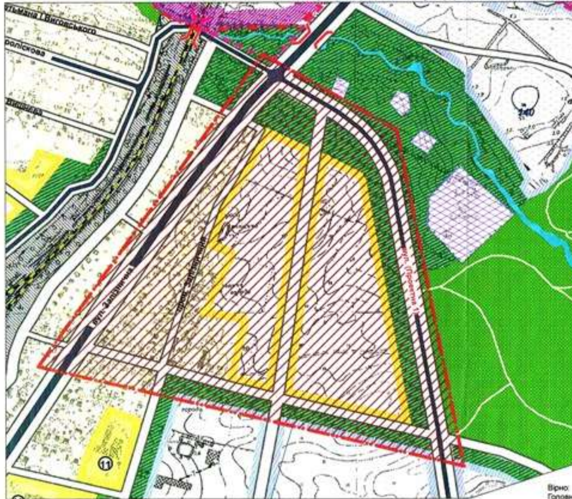
Умовна межа території детального плану

із зазначенням місця розташування ділянки для об'єкта "Детальний план території для розміщення житлового кварталу садибної забудови між вул. Залізничною та вул. (Проектною 1) в м. Коростені"